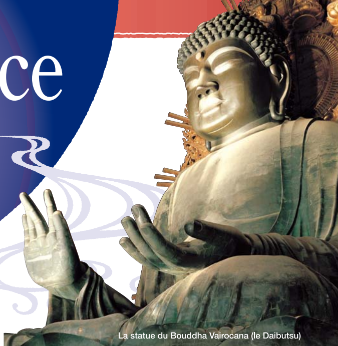
La statue du Bouddha Vairocana (le Daibutsu)

Vous aussi, venez profiter des raffinements traditionnels du berceau historique du Japon.