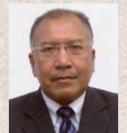
H.E. Datuk Shaharuddin Md Som Ambassador of Malaysia to Japan

Nara adalah sebuah bandar yang terawal di negeri Jepun dan merupakan ibu negeri Jepun yang pertama pada kurun yang ke 8; sebelum ibu negeri Jepun dipindahkan ke Kyoto dan seterusnya ke Tokyo. Pada tahun 2010, Nara telah merayakan ulangtahun ke 1,300 sebagai ibu negeri Jepun. Bersempena dengan usaha Kerajaan Jepun untuk mempromosikan Nara sebagai salah sebuah destinasi pelancongan di Jepun, saya sebagai Duta Besar Malaysia ke Jepun dengan berbesar hati ingin mengambil kesempatan ini untuk mengalu-alukan kedatangan pelancong dari Malaysia ke Jepun dan menghayati keindahan Nara serta melawat tempat-tempat menarik di bandar bersejarah ini.