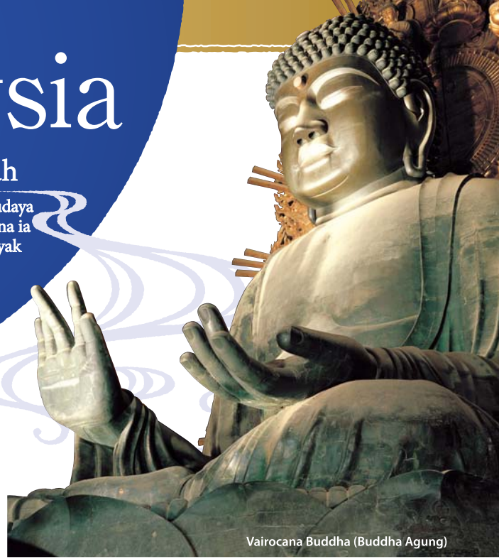
Vairocana Buddha (Buddha Agung)

Menjadi ibu negara Jepun sehingga abad ke-8, Nara merupakan tempat di mana budaya Jepun berakar umbi. Nara juga kaya dengan suntikan budaya antarabangsa kerana ia merupakan destinasi timur Lualan Sutra. Nara dan Malaysia mempunyai banyak persamaan seperti teknik mewarna dan setinggi yang dapat kita lihat dalam khazanah purba. Selain itu juga, sebuah makam putera daripada keluarga diraja Jepun purba yang mempunyai pertalian yang amat rapat dengan Nara terdapat di Johor Bahru. Dengan itu, terdapat banyak episod yang menarik yang menandakan pertalian antara Malaysia dan Nara.