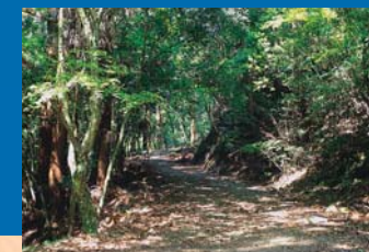
Девственный лес в горах святилища Касуга-тайся

г. Нара, Касугано-тё, 160 ☎ 0742-22-7788 ☉ Главный храм: 6:30 — 17:30 (с апреля по октябрь), 7:00 — 16:30 (с ноября по март) Храмовая сокровищница: 9:00 — 17:00 (вход до 16:30) ☉ Специальное поклонение в главном храме — 500 иен, храмовая сокровищница — 400 иен ☉ От ст. JR/Кинтацу «Нара»: автобус в сторону главного святилища Касуга-тайся-ондэн, рядом с ост. «Касуга-тайся-ондэн»